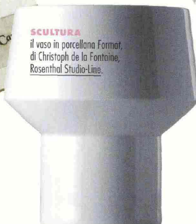
SCULTURA il vaso in porcellana Format, di Christoph de la Fontaine, Rosenthal Studio-Line.