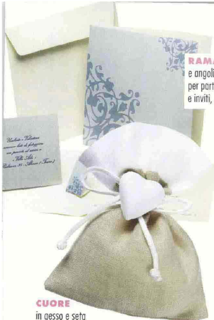
RAMAGE e angoli decorati per partecipazioni e inviti, Micart.