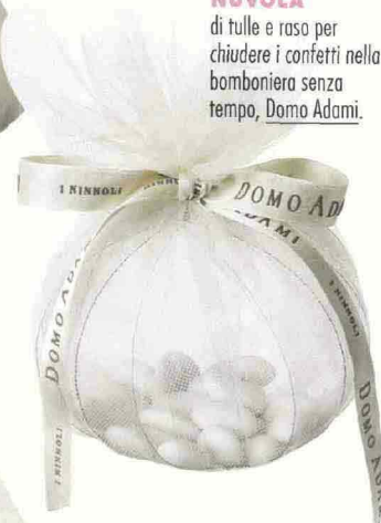
NUVOLA di tulle e raso per chiudere i confetti nella bomboniera senza tempo, Domo Adami.