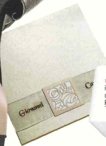
ARTIGIANALI le partecipazioni fatte su disegno esclusivo, Carmela Stilla.